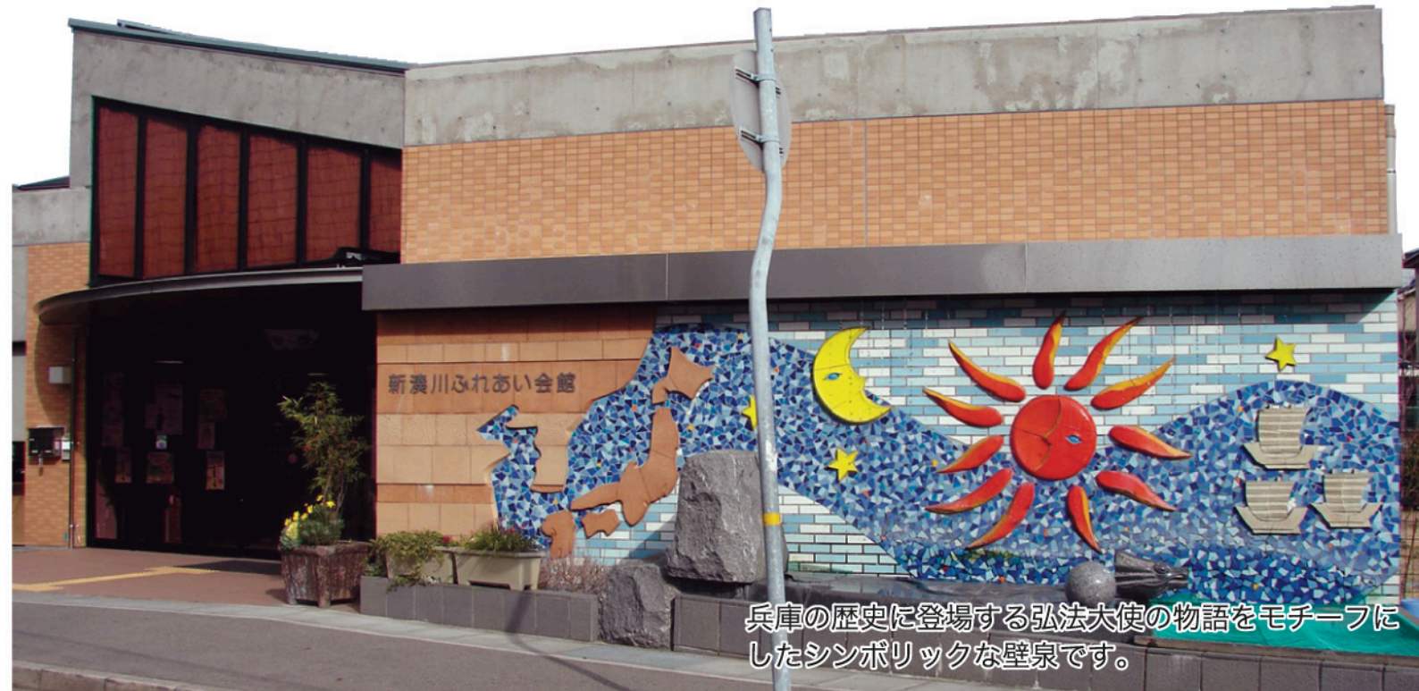
兵庫の歴史に登場する弘法大使の物語をモチーフにしたシンボリックな壁泉です。